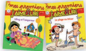
Le copain du CP !