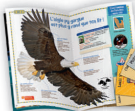
Découvrir la vie de l'aigle pygargue.

1 AN D'ABONNEMENT = 12 N° + 1 NUMÉRO SPÉCIAL OFFERT