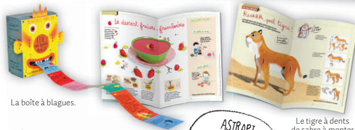
La boîte à blagues.