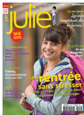
12 numéros par an – 68 pages