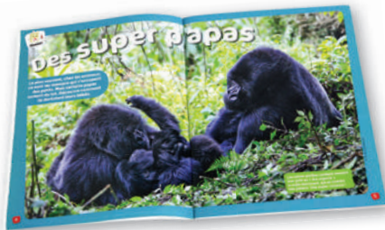
Le dossier du mois

Chaque mois, un poster à détacher, un jeu éducatif et des cartes animaux à collectionner