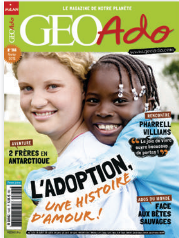
12 numéros par an 68 pages