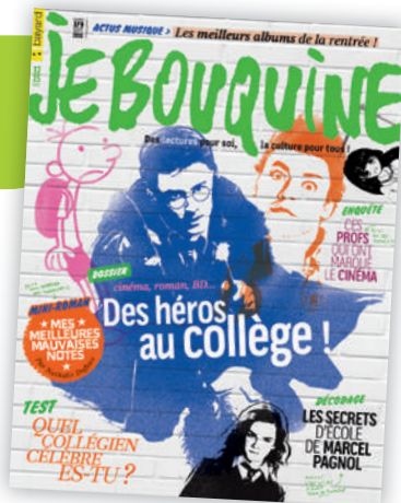
Le magazine culturel des ados.