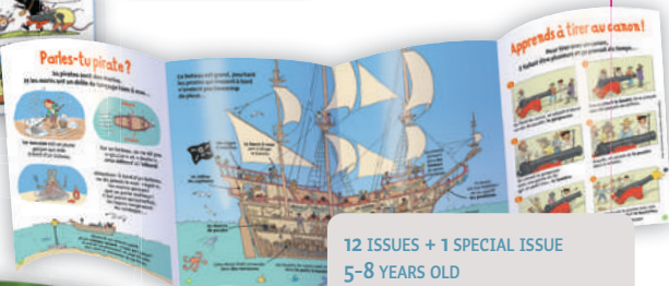
Découvrir l'intérieur d'un galion.