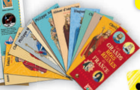
Exemple de surprise : l'éventail des rois de France.