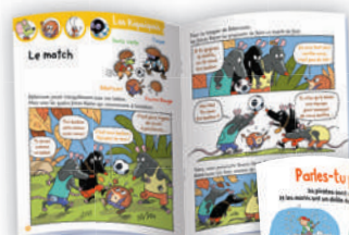
La BD des Riquiquis, des héros toujours plus malicieux et curieux!