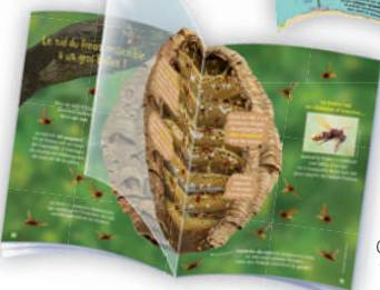
Comprendre comment fonctionne une ruche.

12 ISSUES + 1 SPECIAL ISSUE 5-8 YEARS OLD