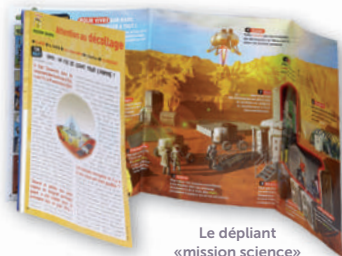
Le dépliant «mission science»

Chaque année, 6 posters double face à détacher et 6 dépliants sciences