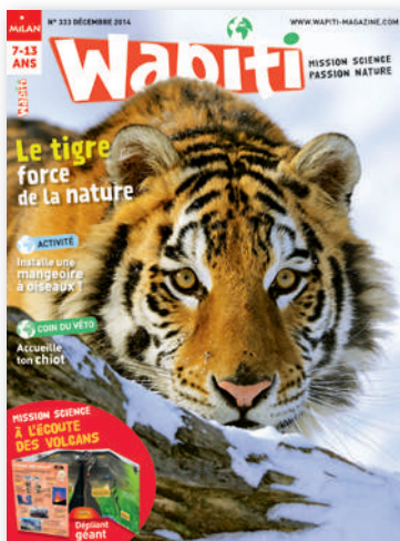
12 numéros par an – 52 pages dont un dépliant sciences ou 1 poster recto verso